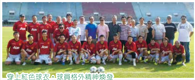
穿上紅色球衣·球員格外精神煥發