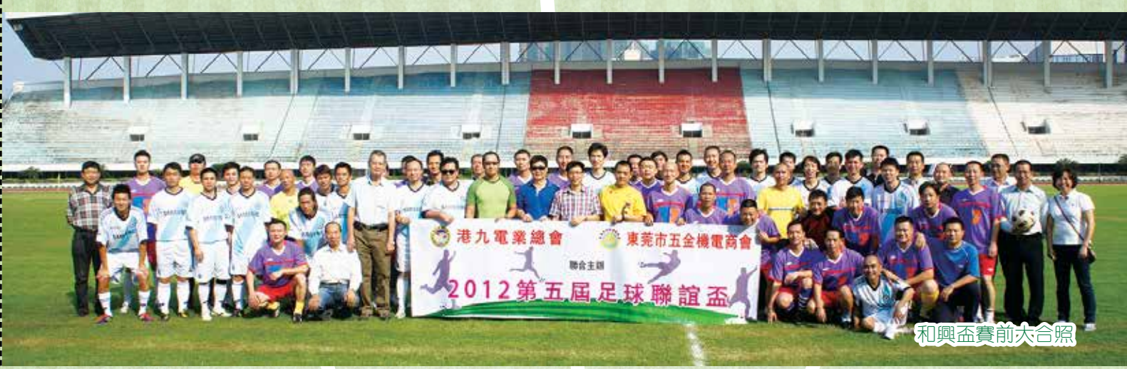
和興盃賽前大合照