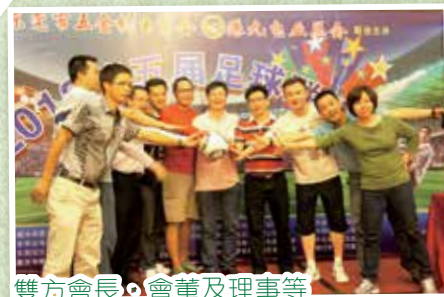
雙方會長、會董及理事等