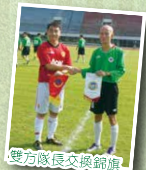
雙方隊長交換錦旗