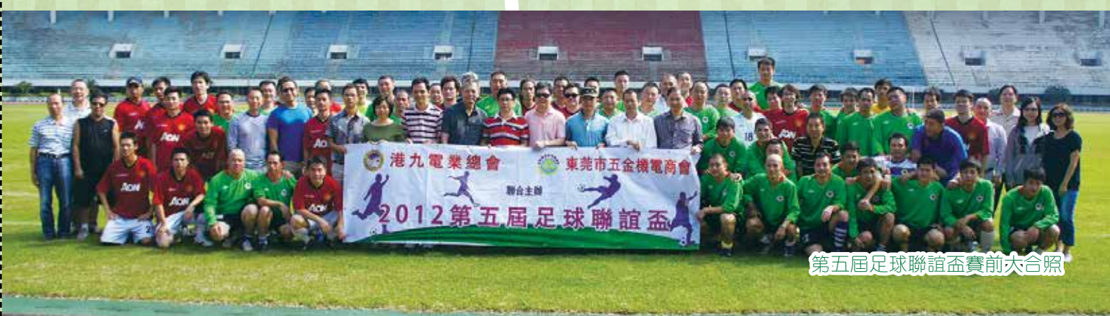
第五屆足球聯誼盃賽前大合照