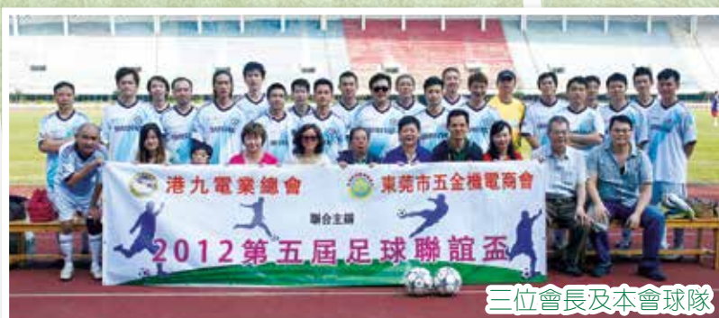
三位會長及本會球隊