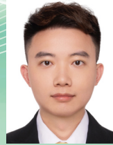
ABB (香港) 有限公司 ABB (Hong Kong) Ltd.

香港九龍灣常悅道 1 號恩浩國際中心 5 樓 E & F 室 Office E & F, 5th Floor, YHC Tower, No. 1 Sheung Yuet Road, Kowloon Bay, Kowloon, Hong Kong. Tel: 2929 3918 Fax: 2929 3505 Email: ryan-ruiyuan.xu@cn.abb.com